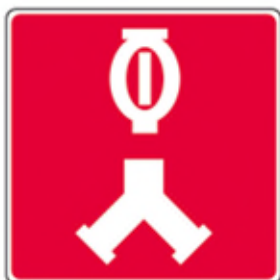
Raccords-pompier pour le réseau de gicleurs