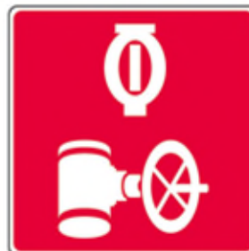
Valve du réseau de gicleurs