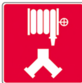
Raccords-pompier pour les cabinets d'incendie