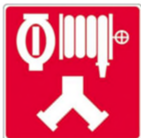
Raccords-pompier pour le réseau de gicleurs et les cabinets d'incendie