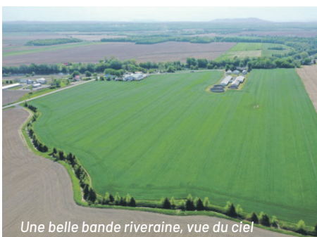
Une belle bande riveraine, vue du ciel

Les comités de bassin versant peuvent également offrir du support en ce qui a trait à la bande riveraine. N'hésitez pas à communiquer avec votre municipalité ou la MRC, afin de voir s'il existe un comité actif dans votre secteur. Vous pouvez leur écrire à cbv@mrcmaskoutains.qc.ca