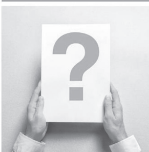
INFORMATION ET SENSIBILISATION