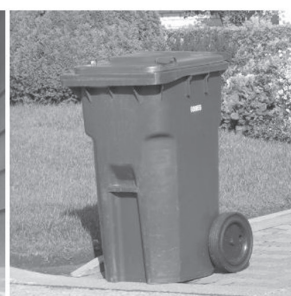
DÉCHETS ET GROS REBUTS