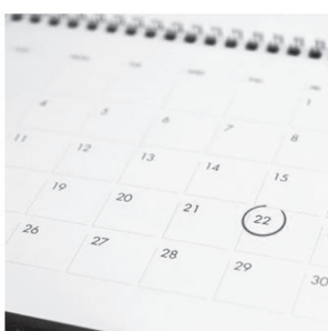
CALENDRIERS DES COLLECTES

SUR VOTRE ORDINATEUR, VOTRE TABLETTE OU VOTRE CELLULAIRE!