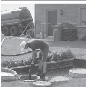
VIDANGES INSTALLATIONS SEPTIQUES