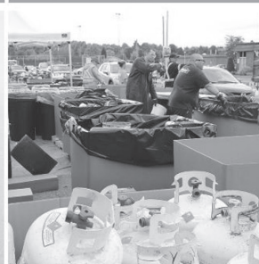
RÉSIDUS DOMESTIQUES DANGEREUX

LA GESTION DES MATIÈRES RÉSIDUELLES N'AURA JAMAIS ÉTÉ AUSSI FACILE!